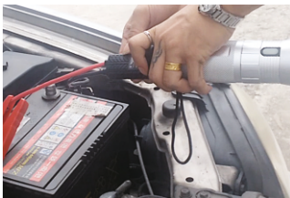
Пуск двигателя авто с севшим АКБ