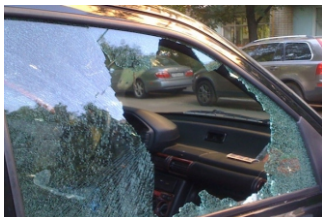
Экстренное разбитие стекла